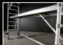
Plattform mit hoher Bodenfreiheit